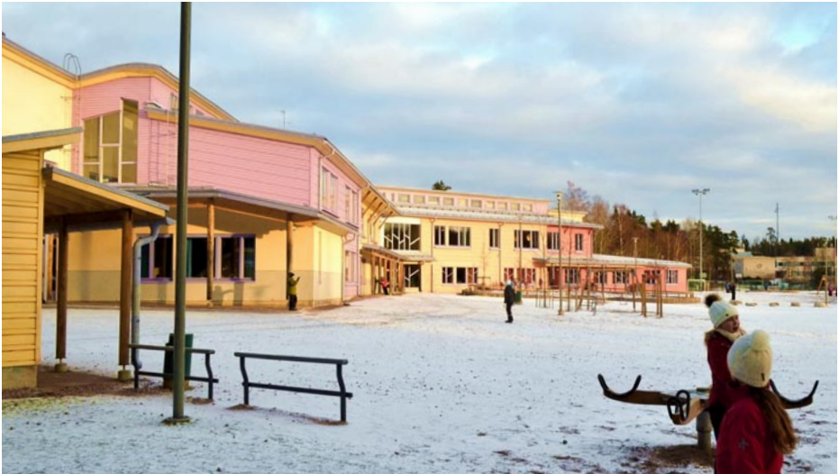
Steiner-koulu loistaa väreineen auringossa.

antroposofiseen filosofiaan. Se aloitti toimintansa 1992, nykyään oppilaita noin 260. Opetusmenetelminä käytetään paljon taidetta ja käytännön töitä. Tavallisten kouluaineiden lisäksi lukujärjestyksestä löytyy eurytmiaa, muotopiirustusta ja bothmervoiimistelua. Rakennus noudattaa myös muotojensa ja värityksensä puolesta steineriläisiä periaatteita.