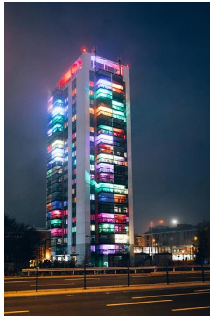
Valolinna, Leppävaara.