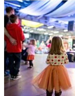
Tapahtuma- ja kulttuuripalvelut

Toiminta-avustusta saavat ammattimaiset kulttuuri- ja taidelaitokset Yli 80 kohdeavustusta saavaa yhdistystä ja yhteisöä