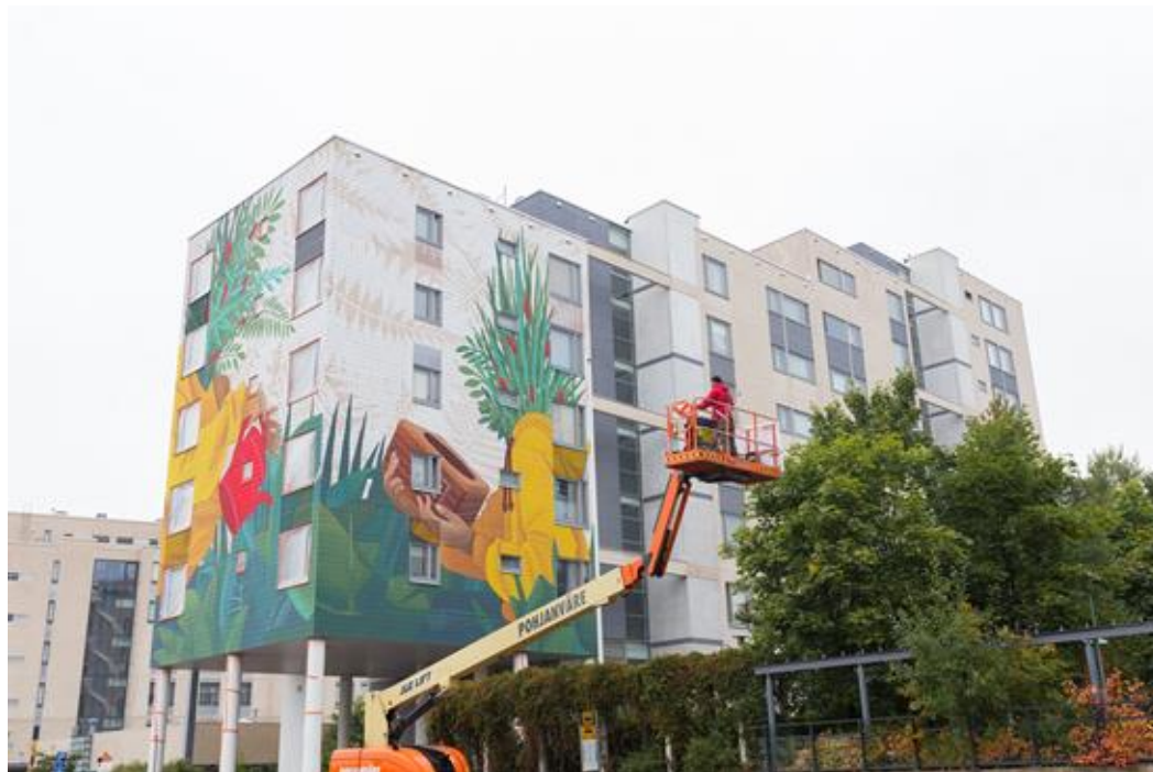
Artez, Matinkylä, Kuva: Tomi Kaukolehto